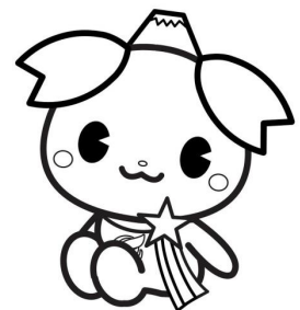
ふじみ野市PR大使ふじみん