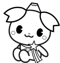
ふじみ野市PR大使ふじみん