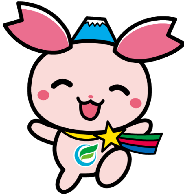
ふじみ野市PR大使『ふじみん』