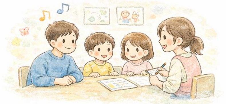
保護者と一緒に支える支援