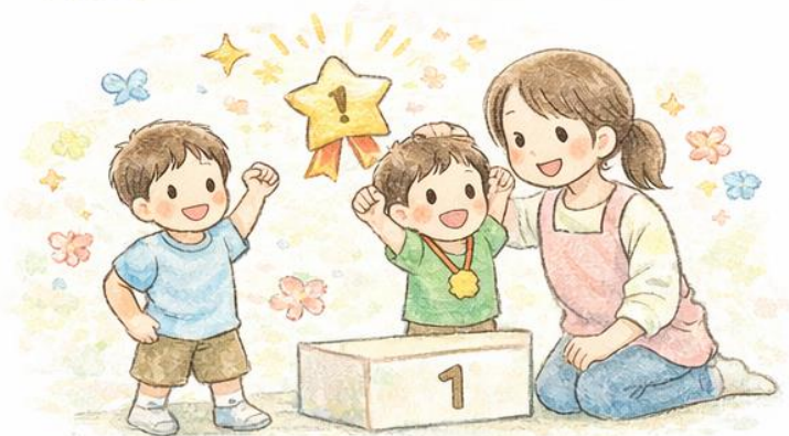
自己肯定感を育てる