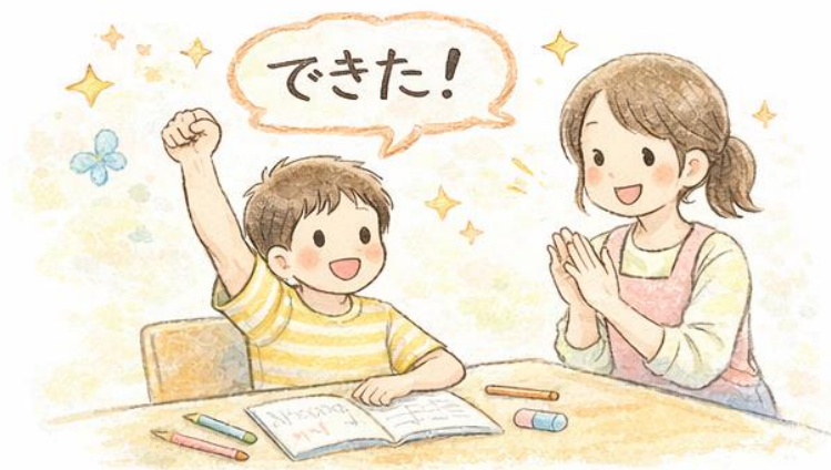
『できた!』の積み重ね