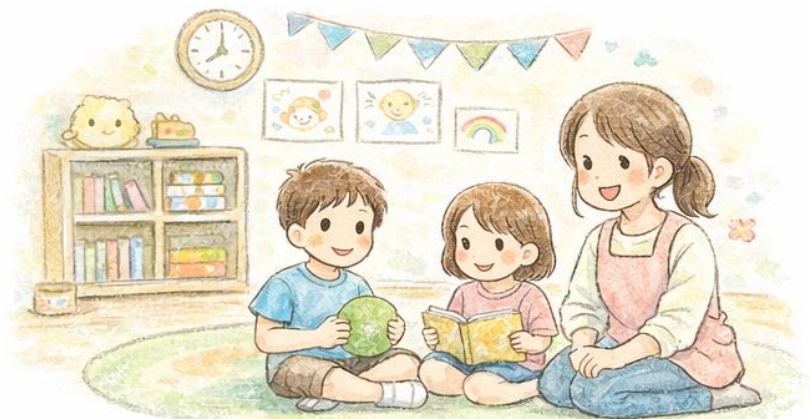
安心できる居場所