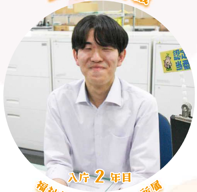
入庁 2 年目 福祉部 高齢福祉課 所属