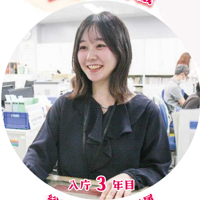
入庁 3 年目 総務部 税務課 所属