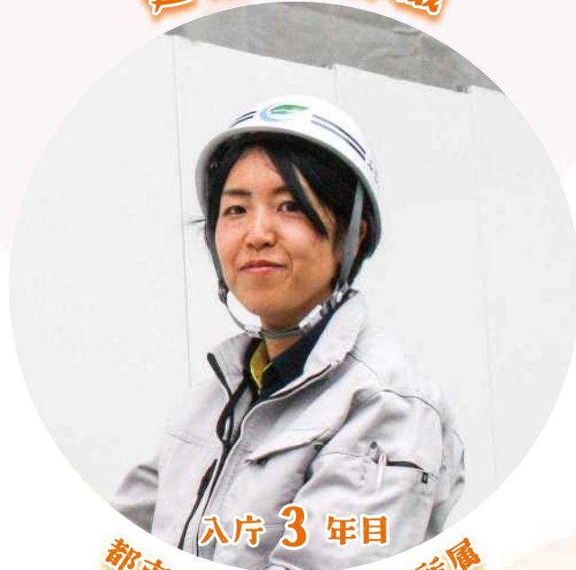
入庁 3 年目 都市政策部 建築課 所属