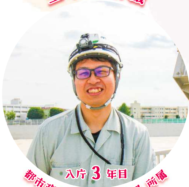
入庁 3 年目 都市政策部 上下水道課 所属