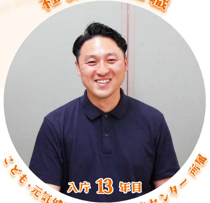
入庁 13 年目 いども・元気健康部 こども家庭センター 所属