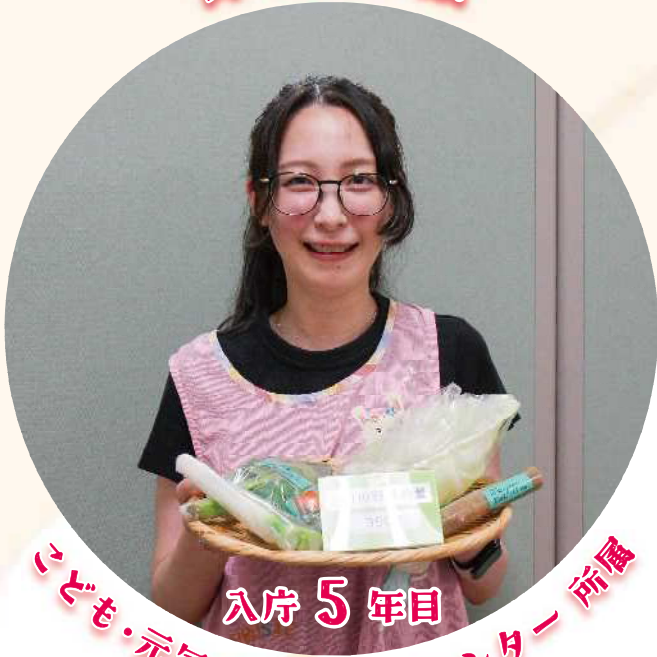
入庁 5 年目 いども・元気健康部 保健センター 所属